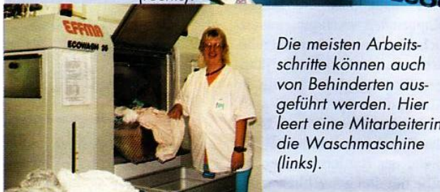
Die meisten Arbeitsschritte können auch von Behinderten ausgeführt werden. Hier leert eine Mitarbeiterin die Waschmaschine (links).