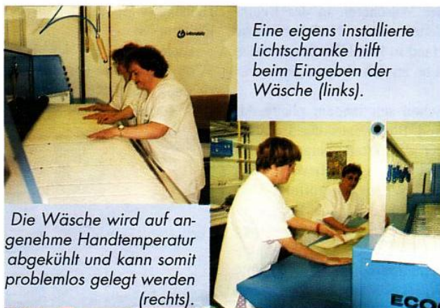
Eine eigens installierte Lichtschranke hilft beim Eingeben der Wäsche (links).