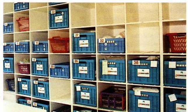
Optisch ansprechend und funktional zugleich: Die Regalwand mit den blauen Containern.

Reinigungsbetriebe eingerichtet. Weiße Bodenfliesen und Regale sollen dem Kunden suggerieren, was dort verkauft wird: nämlich Sauberkeit. Eine Schaufensterpuppe, die je nach Saison und Jahreszeit »ihre Kleidung wechselt« – mal trägt sie ein Ballkleid, dann wieder eine Schützenuniform – soll die Kundschaft gezielt auf zusätzliche Leistungen hinweisen.